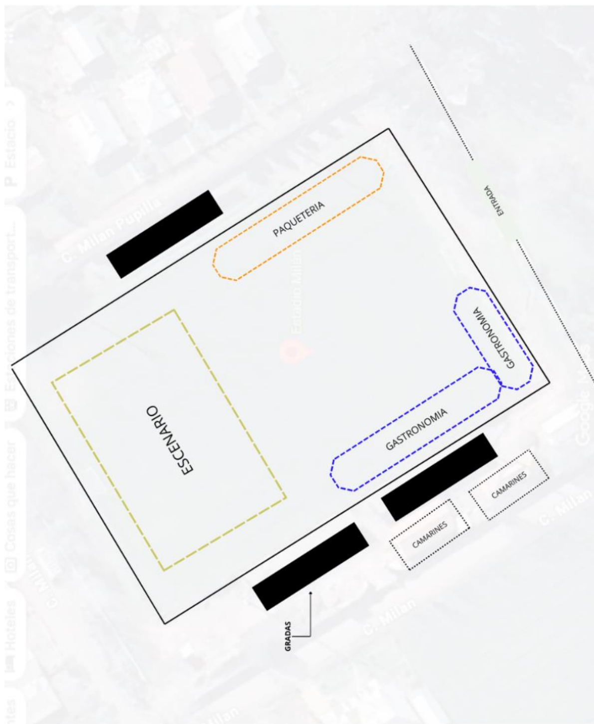
Imagen referencial: Estadio El Milán, comuna de Palmilla - Paquetería.